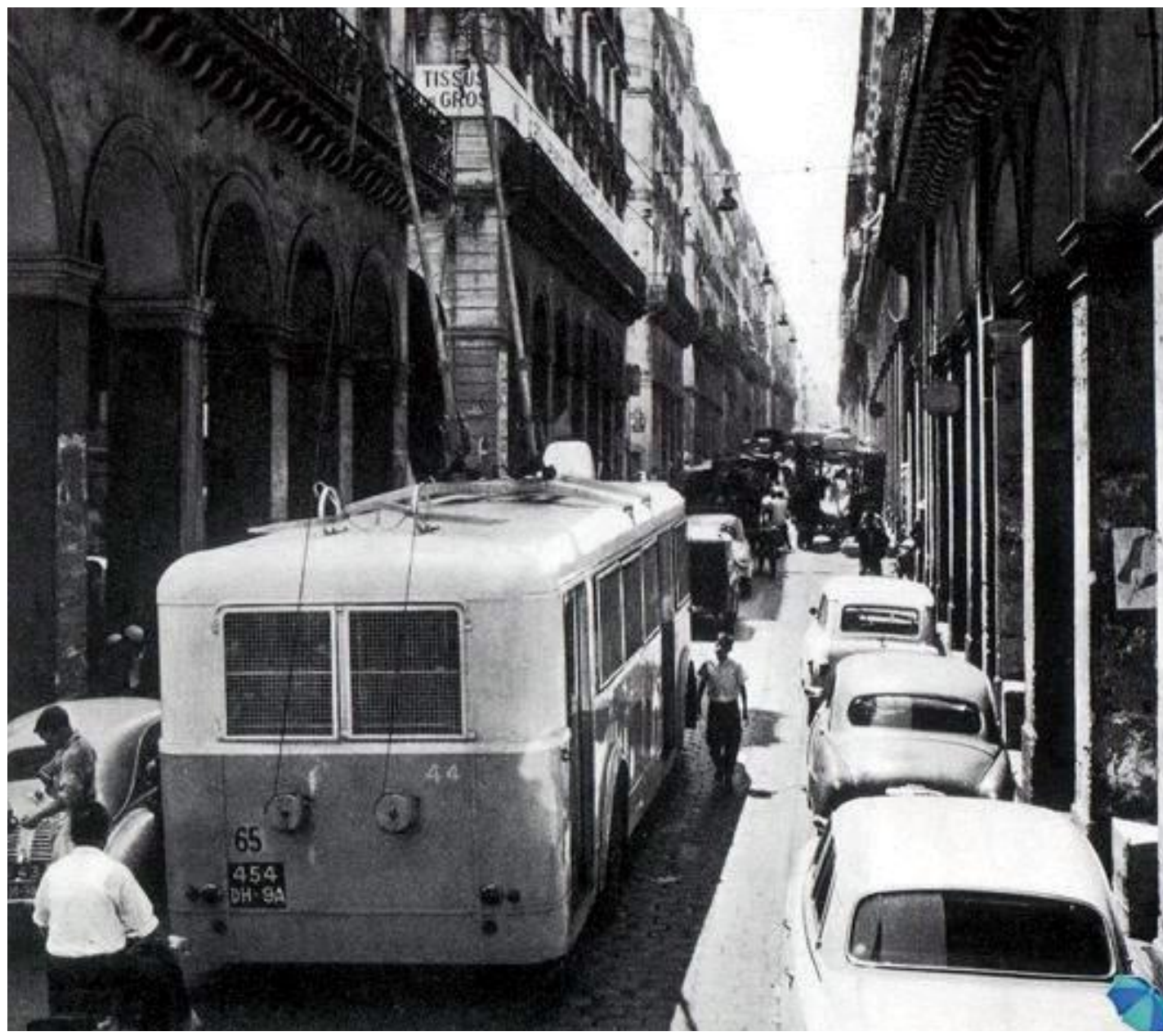
Rue de la Lyre