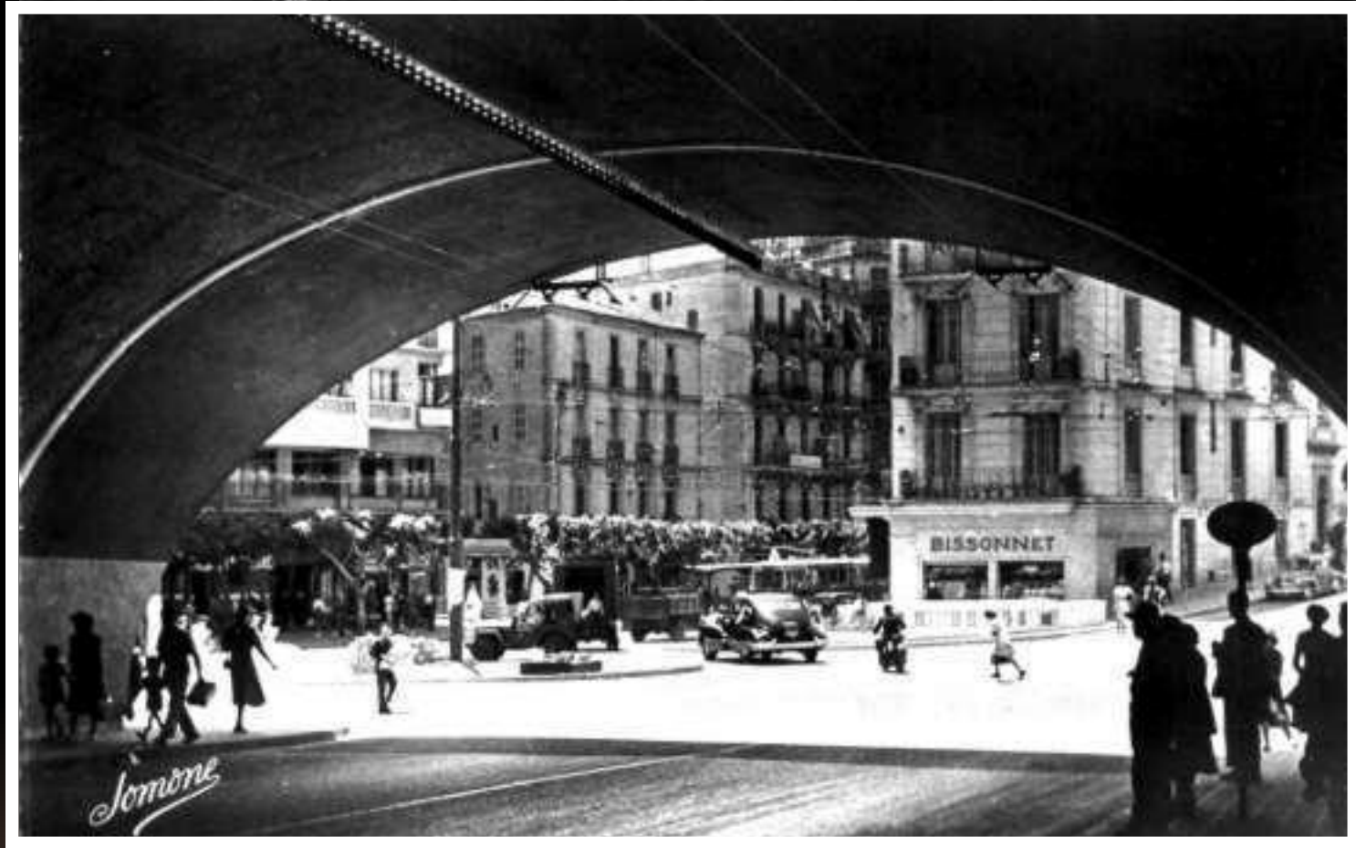
Sortie Tunnel des Facultés