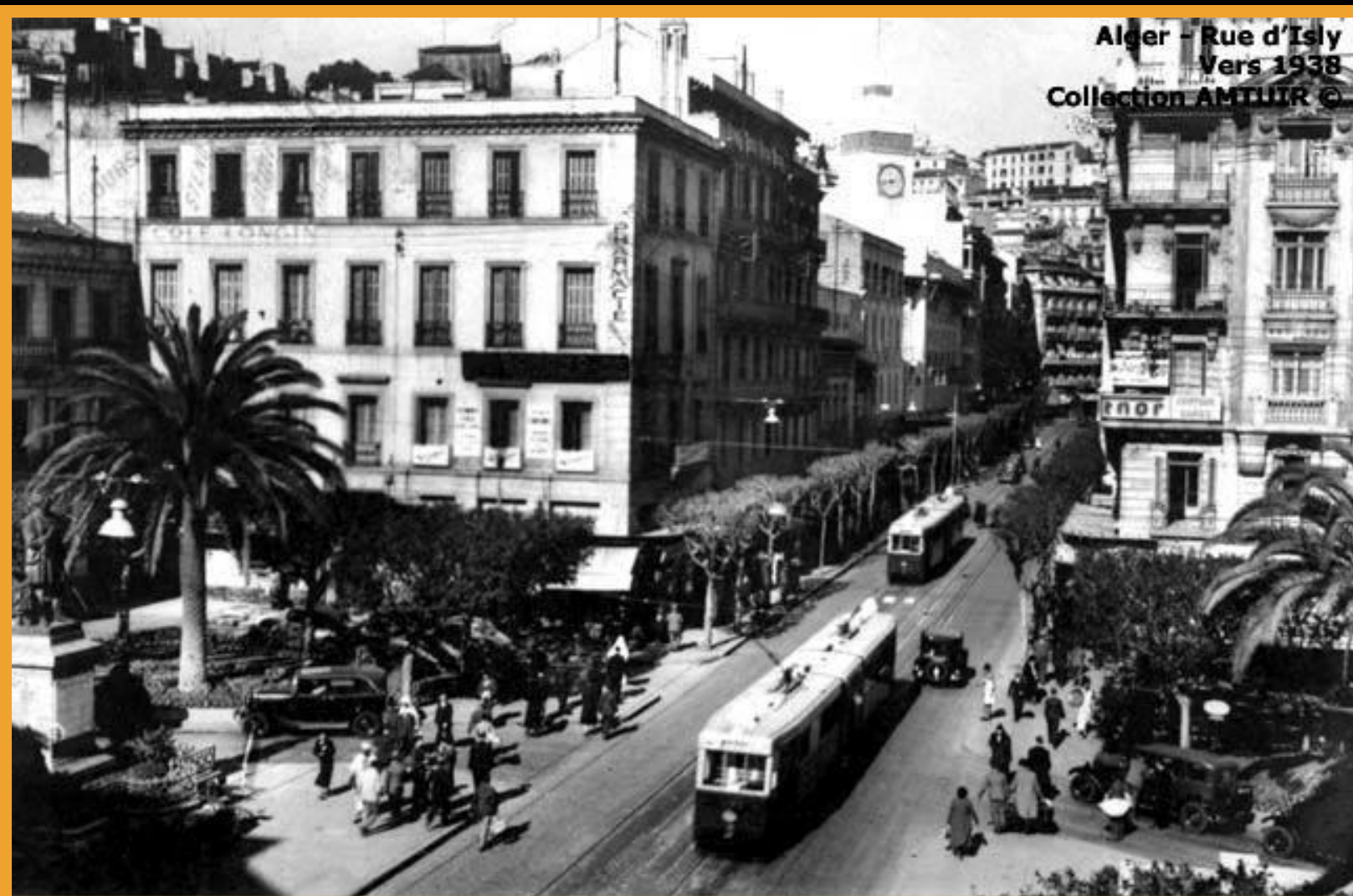
Algier - Rue d'Isly Vers 1938