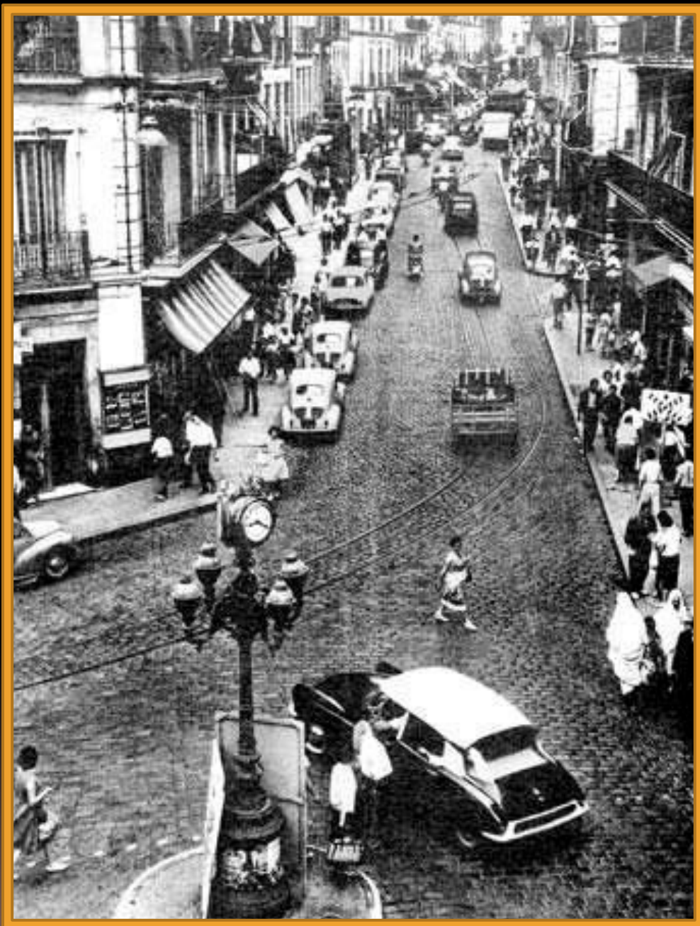
Les 3 Horloges