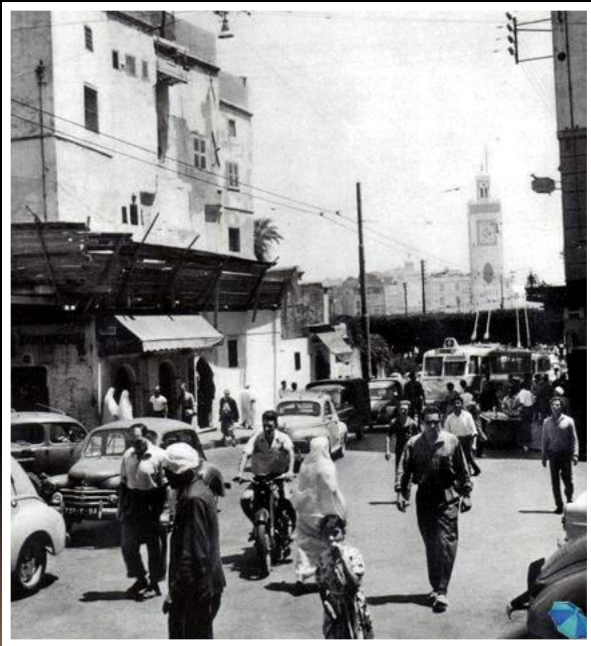
Rue du Divan