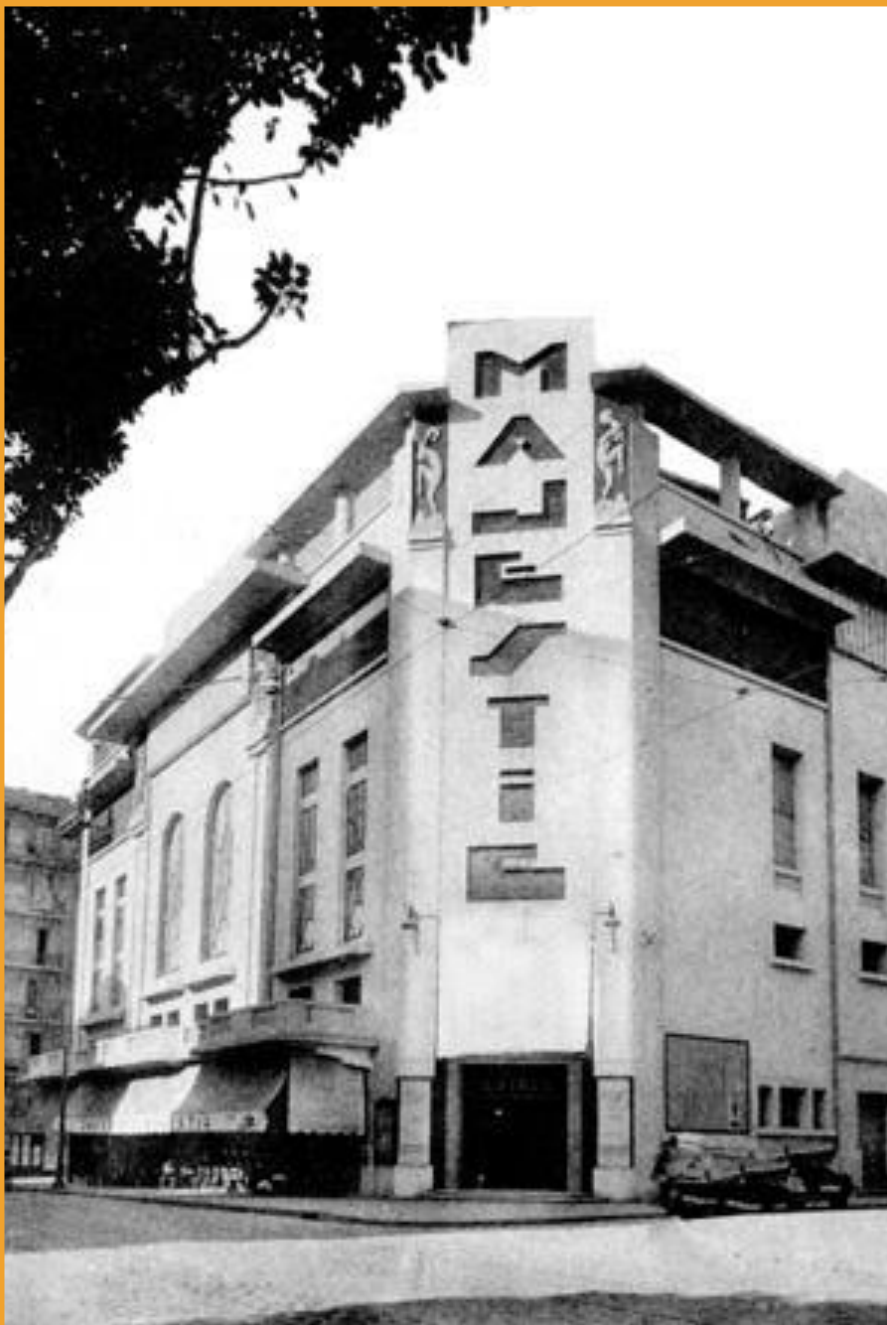
Bab El Oued Cinéma MAJESTIC