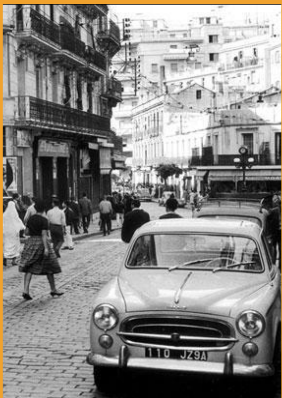
Bab El Oued