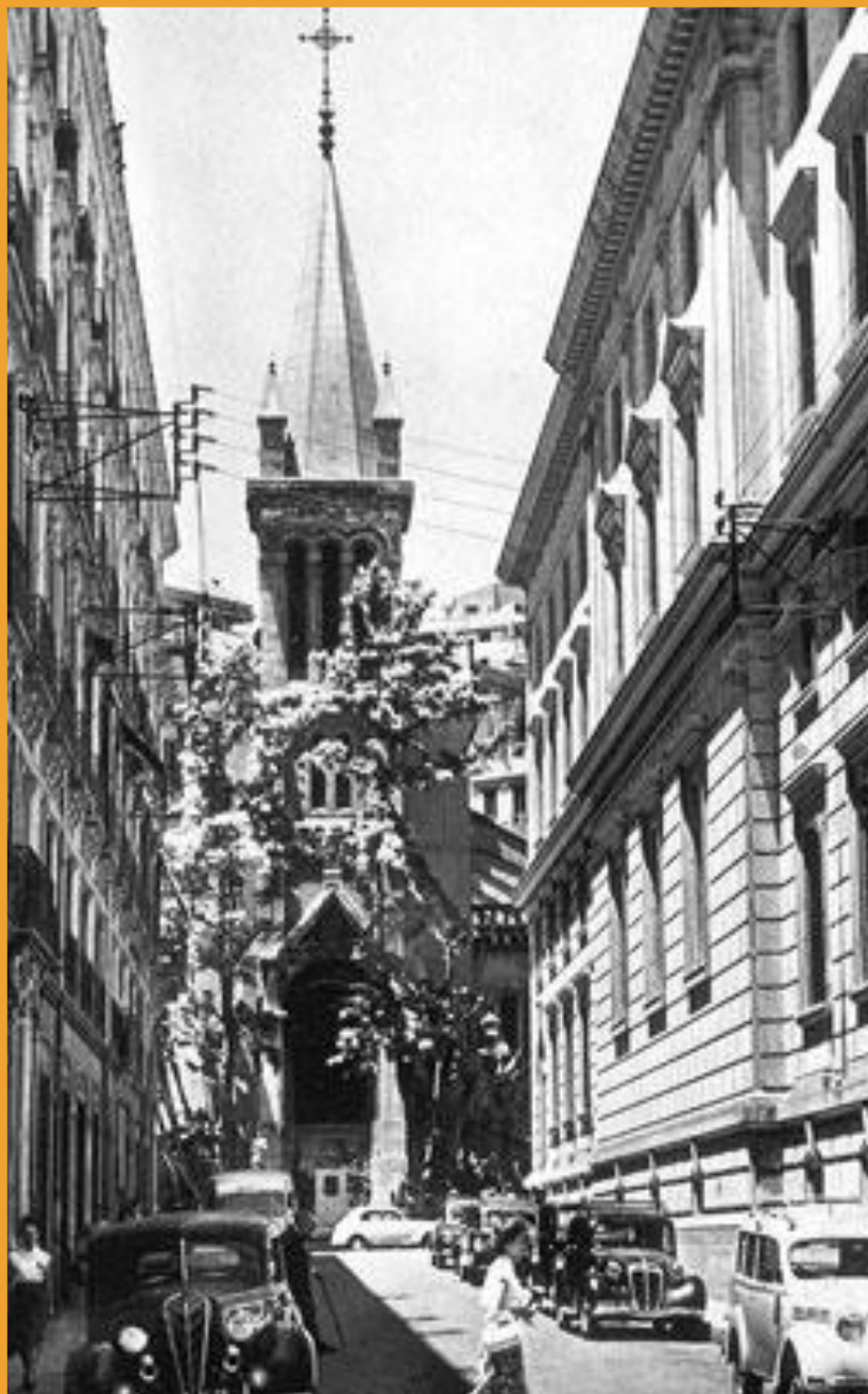
Eglise Saint Augustin