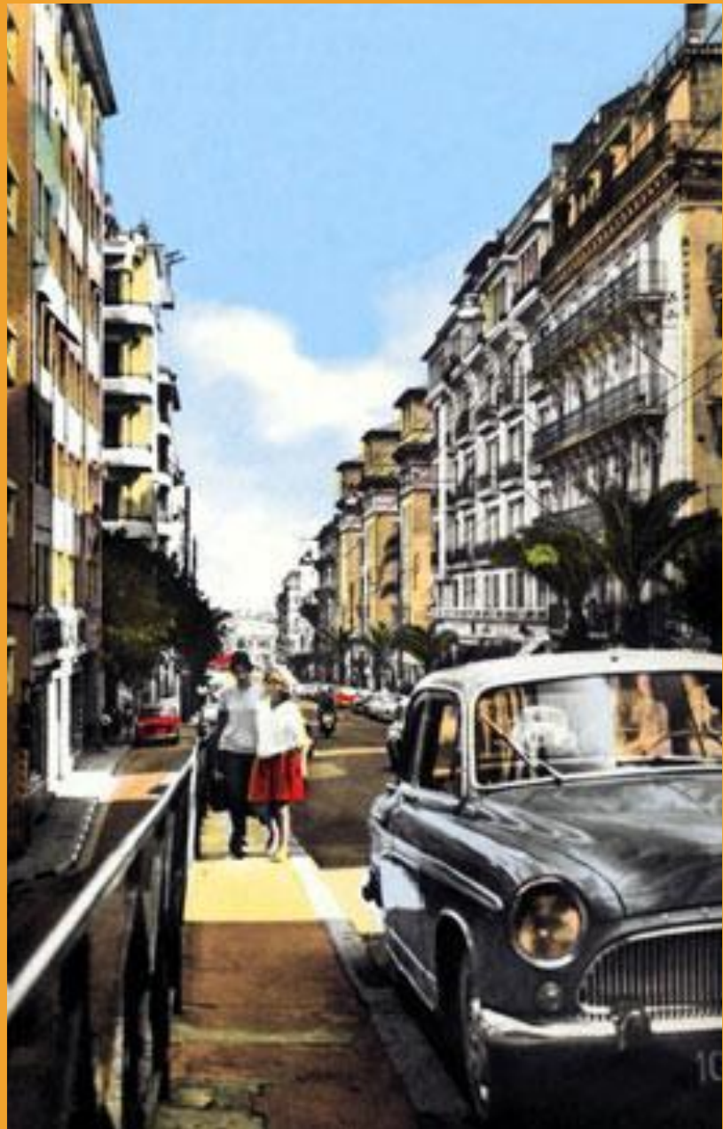
Boulevard Camille Saint Saens